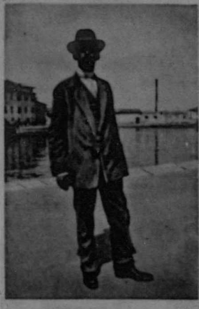
Il Sindaco di Grado.