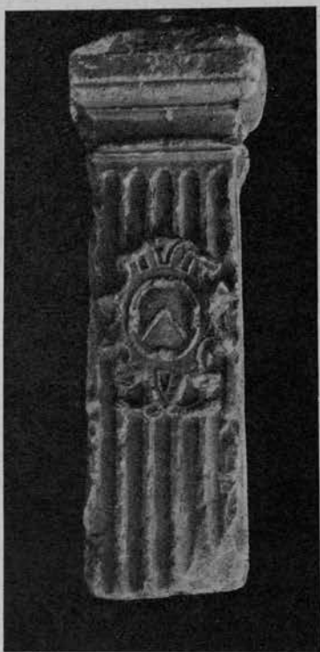
NUMERO 395. (Fot. n. 737).

399. - S. Trinita. — Chiesa di S. Giorgio.