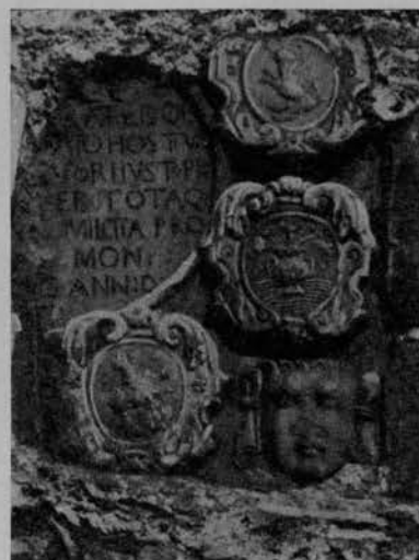
(Fot. n. 463-464).

261-266. — Perivòlja . — Casa alla località Melekleri .