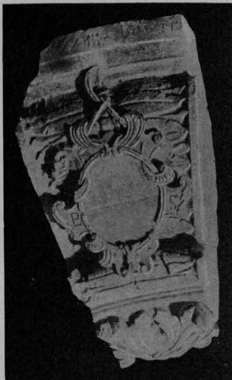
NUMERO 302. (Fot. n. 386).