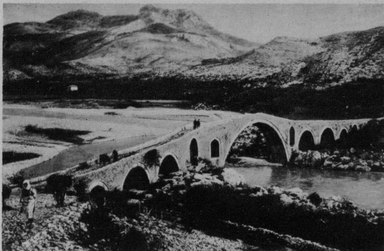
Caratteristico ponte veneziano presso Scutari.

Appartengono alla fine di questa età o ai primi tempi del Rinascimento alcune belle « vere » di pozzo, di arte veneziana, finemente lavorate.