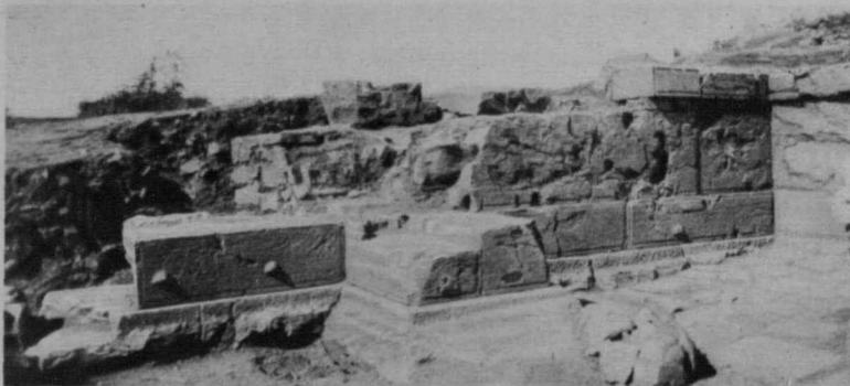
Feniki - La fine lavorazione dei massi del "thesauròs",.

Antichità greche. Dallo scavo di un acervo di terreno venne alla luce un piccolo ambiente, di pianta rettangolare. È esso un thesauròs , ossia uno di quelle costruzioni che in età classica venivano costruite per scopo religioso oppure pubblico. Quattro colonne raddrizzate in alto sono di età romana e trovarono impiego quando in età bizantina il thesauròs subì delle trasformazioni, come dimostra l'anta a destra dell'ingresso, costruita rozzamente e con materia cementante. Il thesauròs infatti fu trasformato in battistero, di cui è ancora con-