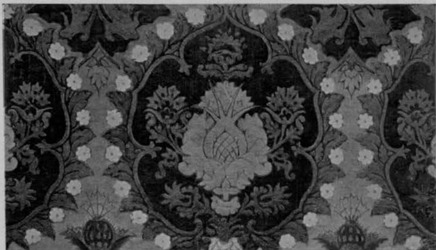
VELLUTO VENEZIANO DEL SEC. XVI.