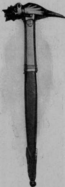
MARTELLO D'ARME (SEC. XV). (Museo Correr).

« vegio de anni « LXX, grande et « de bono aspeto « vestito de pano « doro cremesino « rizo, la veste lon- « ga tanto che due « scuderi lo aiuta- « no a portar dicta « veste, la bireta « de zetonino ros- « so cum uno fris- « so doro a circho. « Et così stava a- « setato in mezo « del veschovo de « Riete et de l'ar- « civesco de Spal- « latro.... Et qui « andaro a li dui « castelli, et lo Du- « xe sposò lo mare « a hore XV, d'uno anello de precio de