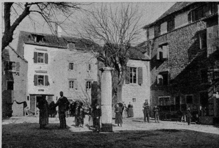
Platz in Castellvecchio bei Spalato.

Ein Tag in Zara genügt, um die Hauptstadt unseres herrlichen Dalmatien zur Genüge kennen zu lernen und der nächste Dampfer bringt uns weiter südwärts nach Sebenico, einer äußerst malerisch terrassenförmig an-