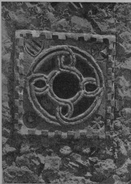
FIG. 351 — *MÈRONAS (AMARI) — FINESTRA DELLA CHIESA DI S. MARIA. (618).