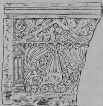
FIG. 21 — FRAMMENTO TROVATO NELLA CHIESA A * KALIVES PRESSO * PISKOPIANÒ.

sono frammenti di colonne e di marmi, taluno con qualche rozzo ornato. Vennero pure scavate quivi delle tombe e trovate delle monete, fra cui un soldo d'oro di Eraclio ed Eraclio Costantino (613-641).