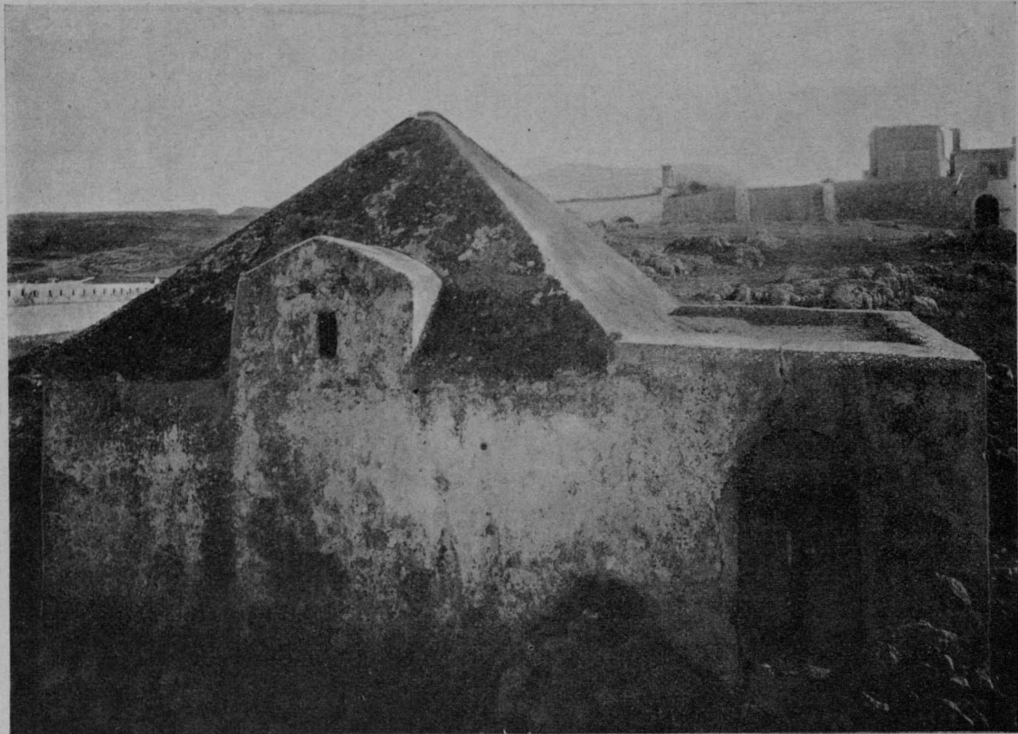
FIG. 58 — RETIMO — UNA POLVERIERA DELLA FORTEZZA. (353).