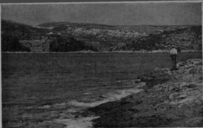
Selca Otok Brač - Ile - Insel Brač