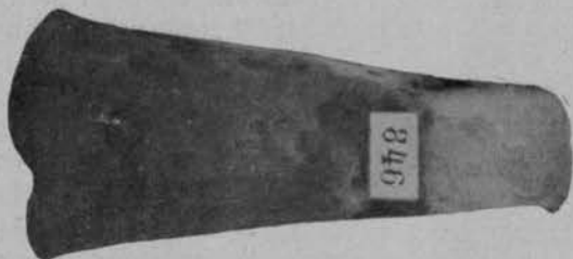
Fig. 153. — Scura di rame trovata a Hierapetra.

I vasi che miss Boyd trovò ad Haghia Photia, insieme colla scure, indicano che essa appartiene alla prima età nella quale usaronsi i metalli. Queste sono forse le scuri più antiche fino ad ora analizzate: esse ci mostrano l'evoluzione che subiscono gli