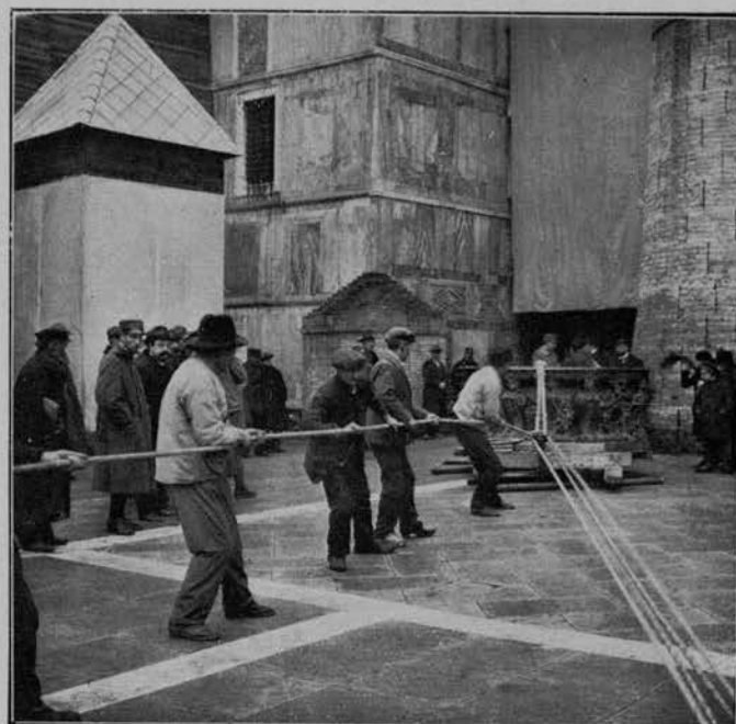
DI FRONTE ALLA PORTA DELLA CARTA