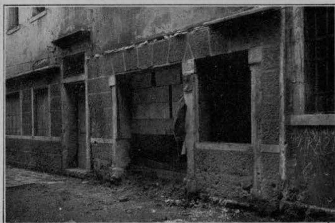
IN CALLE DEI FURLANI