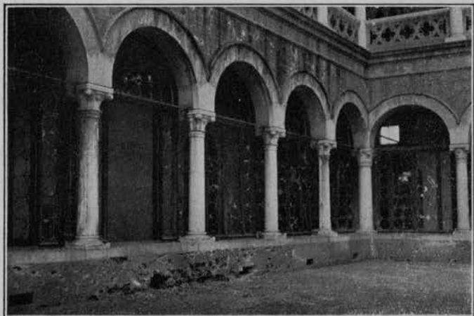
DANNI ALL'OSPEDALE DEI CRONICI