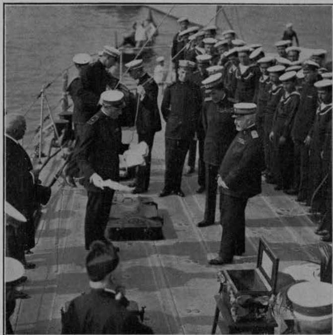
IL DISCORSO DI S. A. R. FERDINANDO DI SAVOIA PRINCIPE DI UDINE