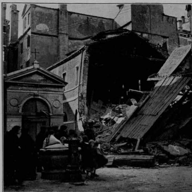
IN CAMPO SANTA GIUSTINA