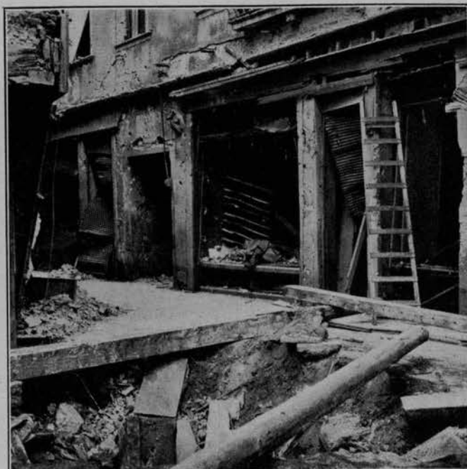
A SAN GIOVANNI GRISOSTOMO