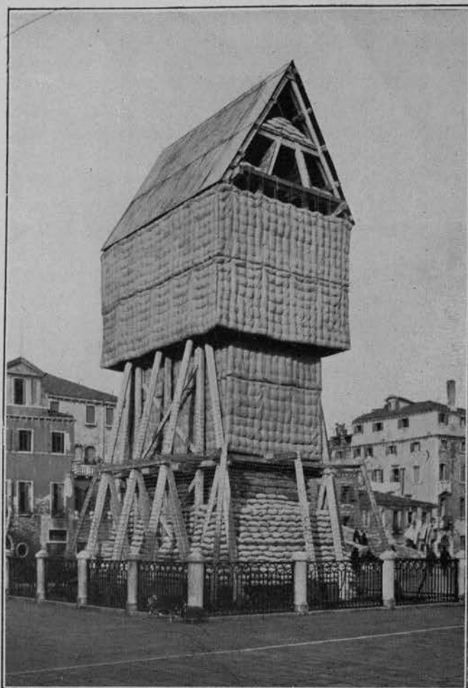
IL MONUMENTO A BARTOLOMEO COLLEONI CON LE DIFESE