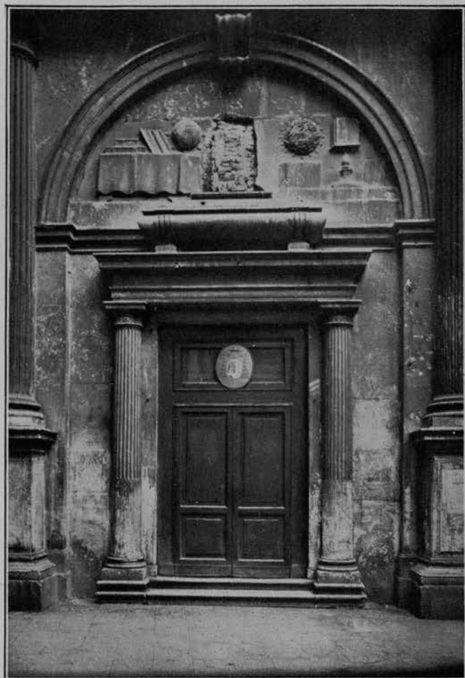
IL PORTALE DELLA CHIESA DI SAN GIULIANO (da cui fu asportata la figura del medico Tom- maso Rangone).