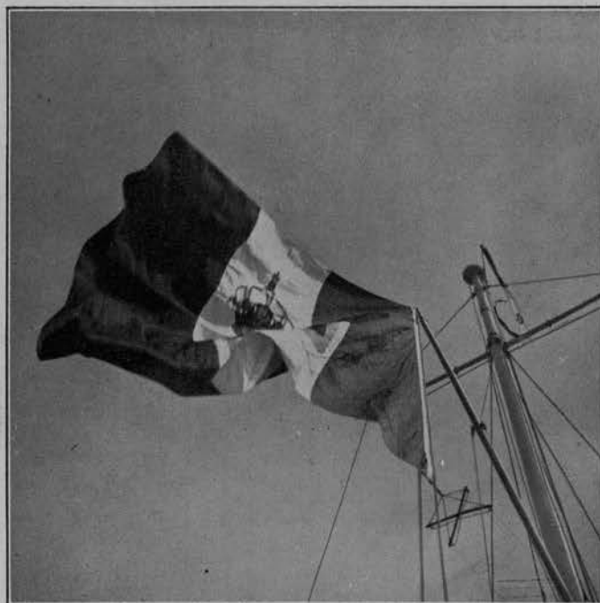
LA BANDIERA AL VENTO